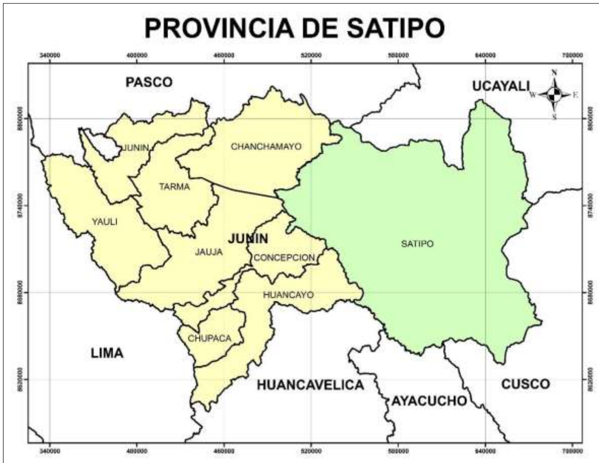
IMAGEN N° 01: MAPA DE LA PROVINCIA DE SATIPO Y SUS LÍMITES